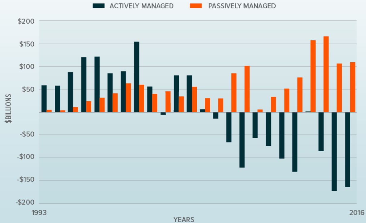
PASSIVE vs. ACTIVELY MANAGED EQUITY ASSETS: NET FLOWS OF U.S. STOCK MUTUAL AND EXCHANGE TRADED FUNDS Note: Does not include money market funds

Os ETFs já são preferência dos investidores estrangeiros. Veja que o gráfico abaixo mostra o fluxo dos investidores saindo dos fundos de gestão ativa para os ETFs.